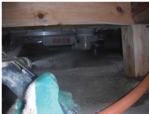
土壌のシロアリ予防 薬剤噴霧中