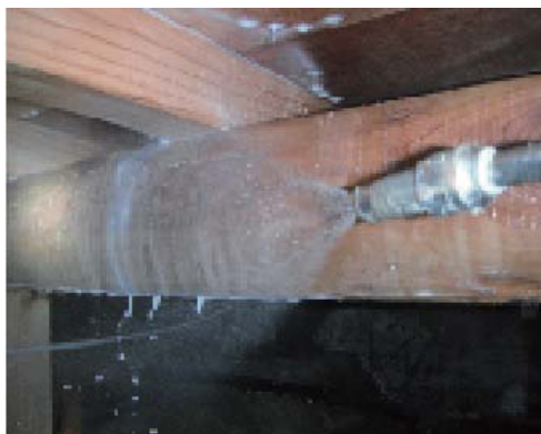
床下木部のシロアリ 予防薬剤噴霧中

なんでもしますよビジョン北川♪今号はシロアリ予防の処置作業をしてきました。大切なお家を守るのも電器屋のお仕事です♪