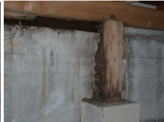
木部のシロアリ被害 ※参考写真

去年リフォームさせて頂いたお客様の所でシロアリ予防処理をしてきました。なんで予防処理したかと言うと・・・リフォームすると床をめくったりお風呂場やトイレを解体します。そうすると水廻り付近を中心にシロアリに食われてボロボロになった木部が露わに・・・リフォームする度に思うんですが、どの家も水廻りはだいたいシロアリに食われています。もちろん北川ではリフォーム中にはそのシロアリに食われた木部やその周辺は補修の為の大工工事をします♪ちなみに安い業者や誠意の無い業者はそのまま見て見ぬふりしてフタをするみたいですが・・・で話をもとに戻しまして、リフォームしたのにまたシロアリ被害になるものイヤですし、去年お盆の豪雨で床下浸水した事も重なって今回シロアリ予防処理を行いました。この予防処理は処置後5年間はメーカー(殺虫剤のフマキラー)が損害賠償保証書をきちんと発行してくれて万が一シロアリが発生した場合、再処理や補修費用を負担してくれます。でも床下見られへんから被害わからんやん!とのお客様無料調査してますのでお気軽に言ってくださ〜い♪