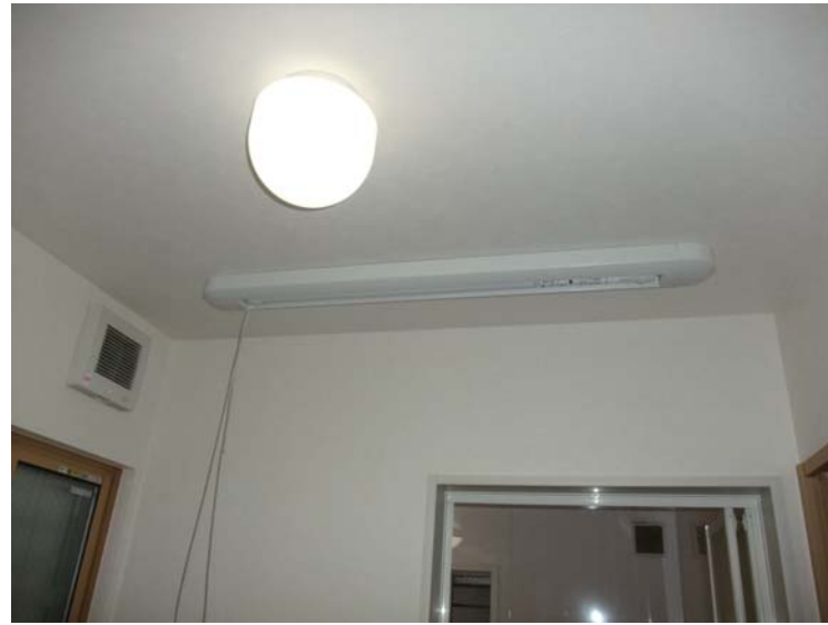
天井取付タイプ 脱衣場などの天井に取り付けます。 竿は紐で引いて上下できます。

前号で軽く紹介してから今月まででこの物干し結局4台も取付しました♪取付ける側から言うと、めっちゃ簡単短時間出来ます！とは言いきりにくい場面もあるんですが(笑)ここは親父パワーで無事解決！取付工事はだいたい半日あれば終わりますよ！それよりもこの室内物干し取付したお客様から「めっちゃイイ」「雨の時や夜洗濯した時は今まで部屋の段差を利用して物干しを何とか固定して洗濯物干してたんやけど、この室内干し取付したら片づけも楽やし見栄えイイ♪」との事。これはほんまオススメですよ♪