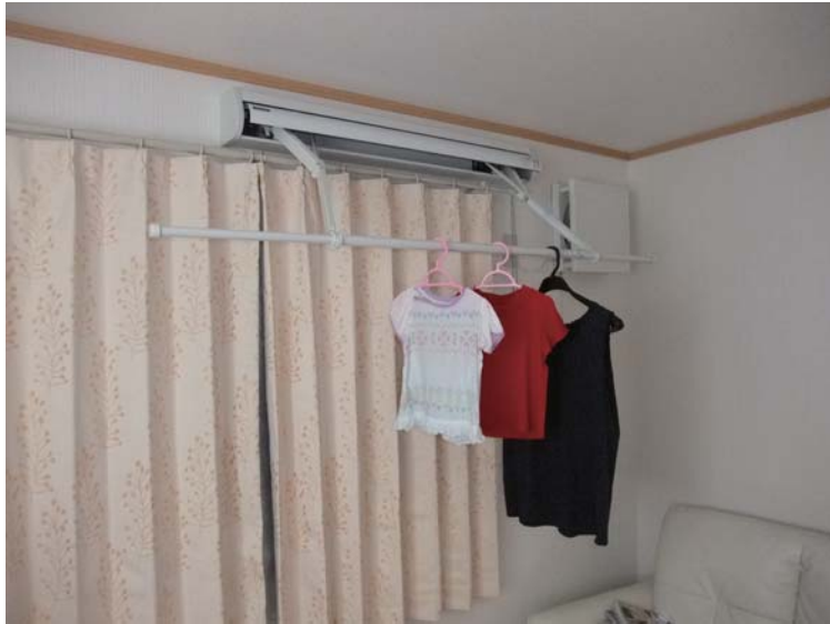
壁掛けタイプ 窓の上に取り付けます。 竿はもちろん収納できます。

プチリフォームと言うか、お家の中が快適になる室内物干しを紹介いたします♪評判上々で超オススメ快適化グッズです！